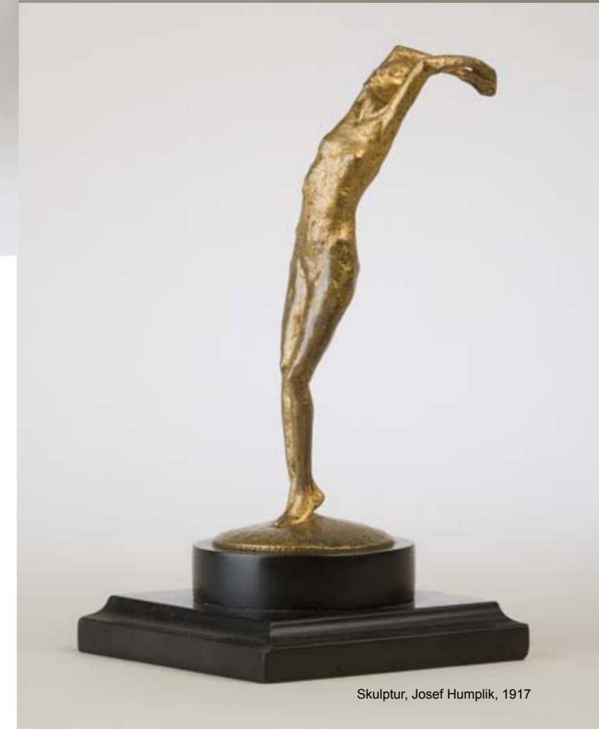
Skulptur, Josef Humplik, 1917