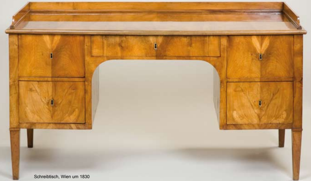
Schreibtisch, Wien um 1830

Klassizismus und Empire angesiedelt entwickelten sich nach dem Wiener Kongress besondere Gestaltungsmerkmale. Material und Konstruktion wurden wesentliche Elemente der funktionellen Gestaltung und die dekorativen Elemente traten in den Hintergrund. Klare, geometrisch betonte Grundformen und raffinierter Einsatz von Holz Furnier zielten auf eine einheitliche Wirkung hin. Die Möbel waren funktionell und auf die unterschiedlichen Aufgaben des Wohnens zugeschnitten. Dabei durften neben Sitzmöbeln weder Schreibtisch noch Vitrine fehlen, ergänzt durch aufwändige textile Gestaltungen und die entsprechenden Beleuchtungskörper.