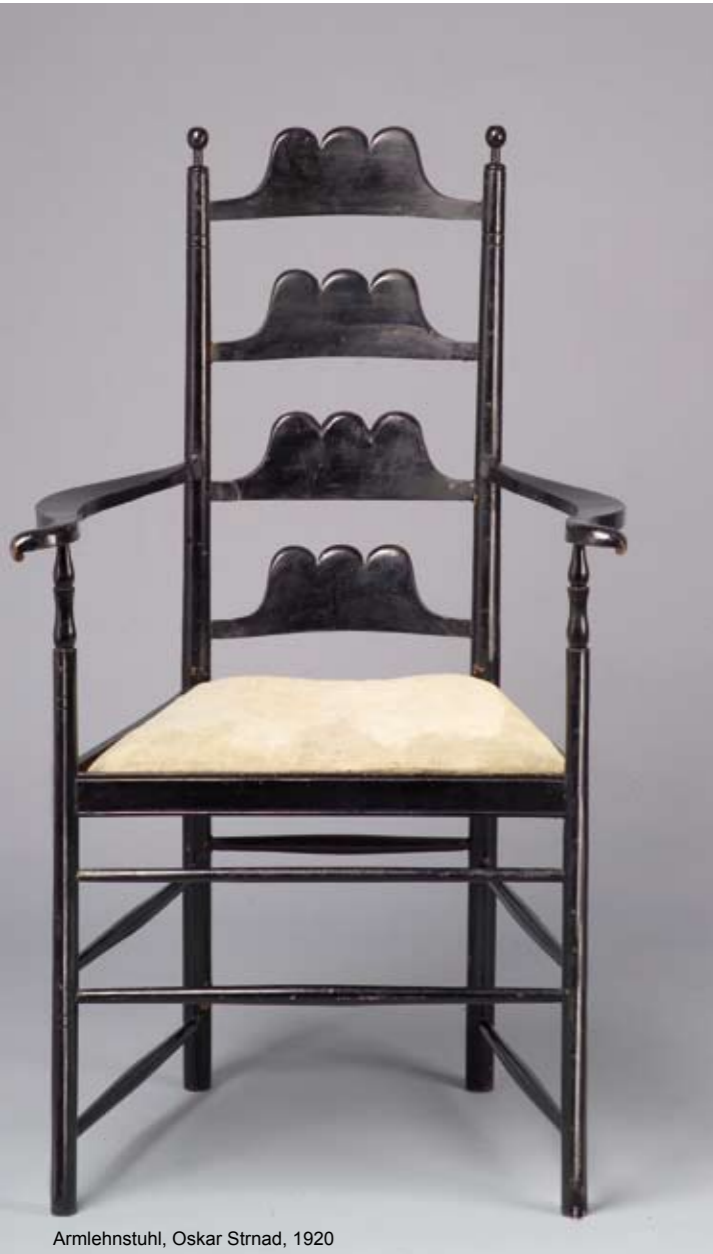
Armlehnstuhl, Oskar Strnad, 1920

Im Jahr 1920 fand mit dem Titel „Einfacher Hausrat“ in Wien eine Ausstellung im Österreichischen Museum für Kunst und Industrie statt, die einen Überblick über den Stand der Wohnungsreformbewegung gab und Hilfe bei der Beschaffung einfachen, jedoch künstlerisch einwandfreien Hausgeräts geben sollte. Schon während des 1. Weltkrieges, im Jahr 1916, war eine gleichnamige Publikation erschienen.