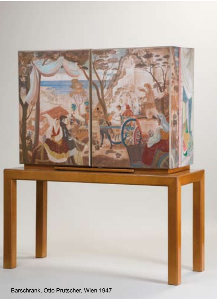
Barschrank, Otto Prutscher, Wien 1947

Große österreichische Kunstausstellung 1947