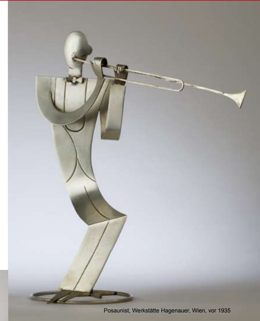
Posaunist, Werkstätte Hagenauer, Wien, vor 1935