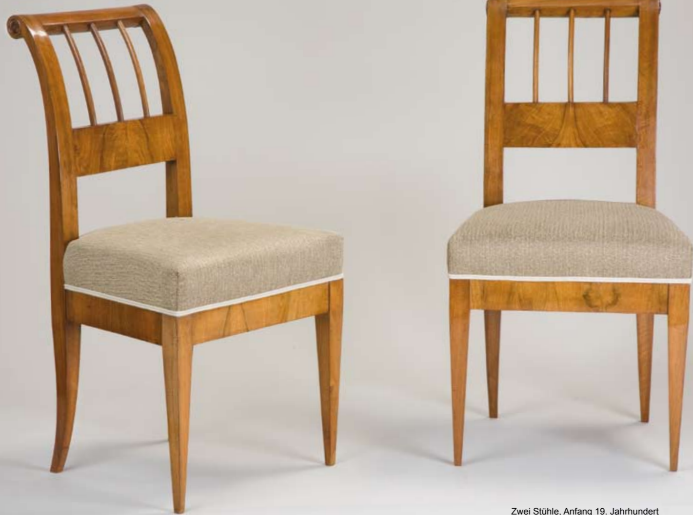
Zwei Stühle, Anfang 19. Jahrhundert

Wiener Mobiliar aus der 1. Hälfte des 19. Jahrhunderts